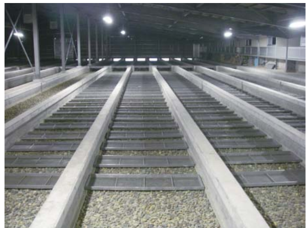
写真6. 養魚池用ふ化盆 砂利の上に平行に置かれた管状の塩化ビニール製の盆 ふ化した仔魚は盆の網目を通して砂利の間隙に落ちる