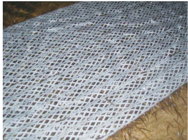
写真5. ネットリング 複数のネットリングを並列に並べて使用する 中空に仔魚が入っている

施設に関しては、北海道では冬期の降雪、寒気などの厳しい気象条件に対処するため、養魚池に上屋が整備され、仔魚の安静な管理や観察が容易なものとなった 1) 。また、防疫対策や仔魚の安静な管理のために、養魚池と卵を収容するふ化室との間に隔壁を設け、独立した管理棟とする施設整備も行われている。一方、本州では敷地の制約などから北海道のように大きな面積を必要とする養魚池ではなく、浮上槽(発眼卵を収容し、ふ化から浮上期までを管理するアルミ製のボックス形状の容器)と呼ばれるふ化器が開発され、これを用いて仔魚管理が行われている 35) 。