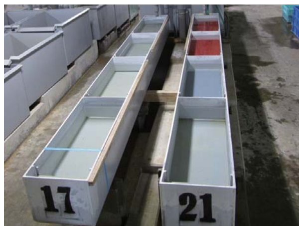
写真1. 増収型アトキンス式ふ化器 長さ3.5m、幅35cm、深さ30cmの塩化ビニール製 一水槽当り40万粒の卵を入れることができる

1888年の千歳中央ふ化場の開設は、わが国のさけます類の人工ふ化放流技術の発展の原点であり、この地を中心とした数多くの試行錯誤の繰り返しを経て、わが国に適合した技術に発展していく。戦後間もない1951年に水産資源保護法が施行され、1952年に「北海道さけ・ますふ化場」が設置されてからは、北海道さけ・ますふ化場による様々な調査研究や技術開発により、現在の技術が形作られていくことになる。特に1960年代に入ってから、サケ稚魚の給餌飼育の導入(1962年)、増収型アトキンス式ふ化器(写真1)及びボックス型ふ化器の