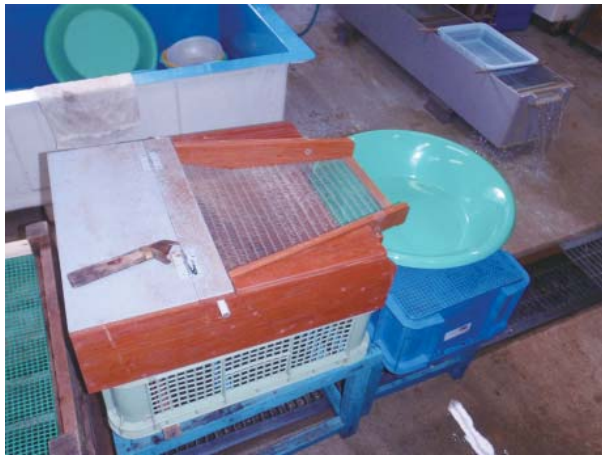
写真2. 採卵台 水色に塗られた板の上で開腹し、台の右側にある簀の子状の網に卵をかき出す かき出された卵は青色の容器（受卵盆）に入れられる

まで、蓄養と言って一定期間生簀や飼育池に收容して卵が成熟するのを待つ必要がある。蓄養中における過度のストレスや運動は、魚体の損傷や体力の消耗による死亡につながることから、親魚を安静に保つことが重要であり、そのための蓄養池の構造や注水方法などに関して技術開発が行われた 17,18) 。特に、蓄養池での注水部から排水部に向かう水平的な流れが、親魚を注水部付近に蝟集させ、魚体の損傷などによる死亡の原因となっていたが、注水部を蓄養池中央部付近の池底に設けた注水方式の改善は、これらの問題の解決や卵質の向上にもつながる画期的な技術開発となった 1) 。