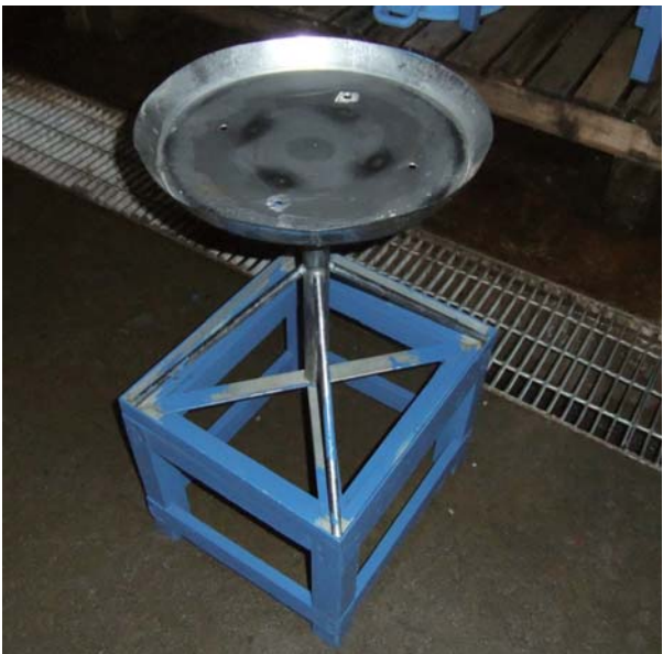
写真3. 攪拌台 受卵盆を三脚上部の天板に載せ、回しながら授精させる