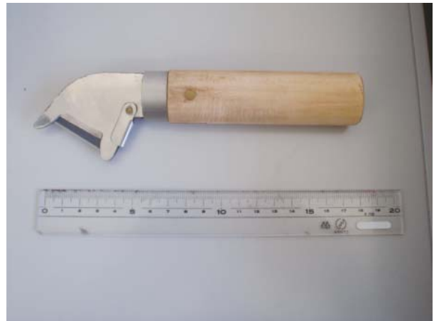
写真4. 採卵刀 刃は片刃のカミソリを用い、交換できる