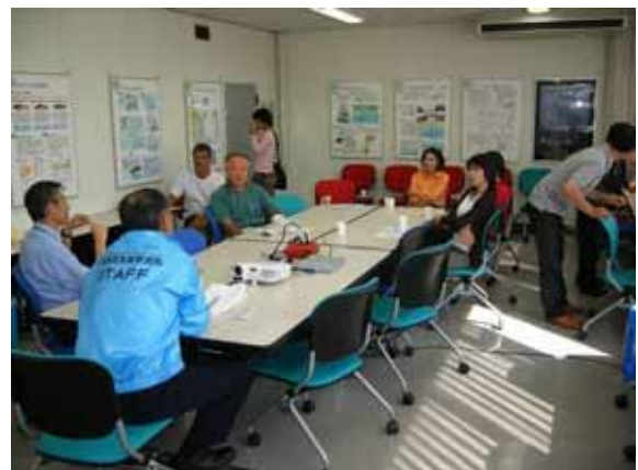
図4. 一般公開で開設したさけます類に関する体験・展示コーナー。上)サケクイズで出題された問題の一つ。中)鮭の解体の実演。サケの体の仕組みや料理方法を解説。下)おさかなカフェでの来場者との懇談。