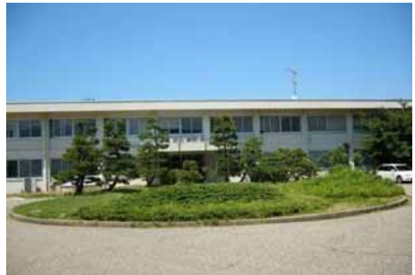
図1. 日本海区水産研究所の庁舎。平成18年度にさけます類の担当部署として調査普及課を設置。

本州日本海域のサクラマス資源の再生を目指した平成 18 年度のプロジェク研究を、山形県、富山県、さけますセンター等とともに実施しています。サクラマスは当地域をはじめとする北日本の沿岸漁業、内水面漁業、さらに遊漁において重要な魚種の一つですが、近年その資源量は減少し続けています。この研究では、その資源再生のため、これまで行われてきた人工ふ化放流の検証、サクラマスの遡上と産卵の実態の調査、資源再生に向けた問題点の洗い出し等が行われています。その中で私たちは、各河川のふ化放流に関するデータの収集と整理を行い、また、富山県神通川、山形県最上川において、サクラマス幼魚の河川内分布や越冬期における生態等を、山形県内水面水産試験場、富山県水産試験場と協同して調査して