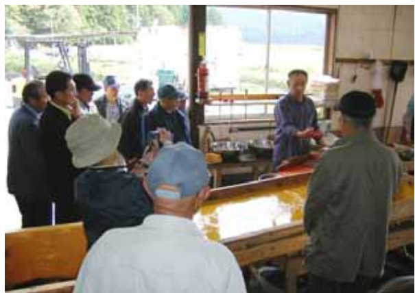
図2. 技術講習会の中で行われた採卵実習の様子。写真は山形県月光川の箕輪ふ化場を会場とした講習会。