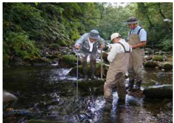
図3. サクラマス生息環境の調査。プロジェクト研究の一環として、対象河川においてサクラマスの生息環境や生態の調査を実施。