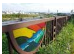
写真 (上) 札幌市の中心部へと流れる豊平川。河畔の緑地は市民にとって憩いの場となっている。(下)豊平川に沿って続く柵。描かれているのはもちろんサケ。