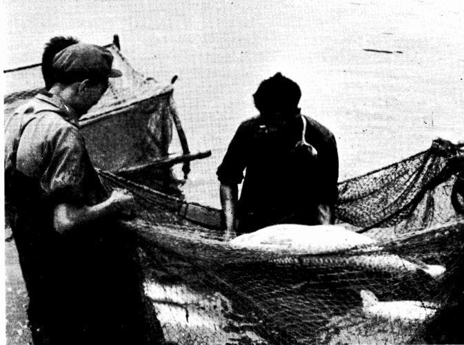
捕獲された 魚はハクレン