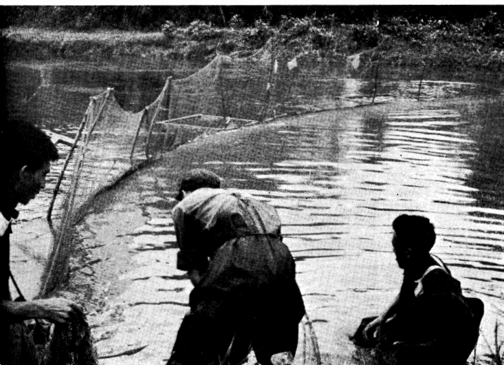
試験池内での 捕獲作業 (24頁参照)