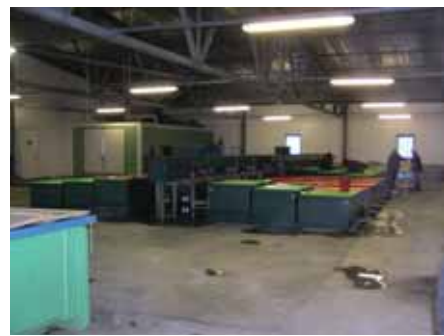
写真12. アニフスキーふ化場ふ化室.