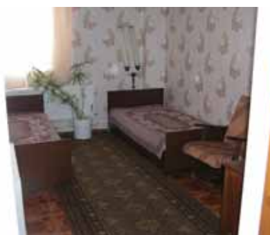
写真16. アニフスキーふ化場ゲストルーム.