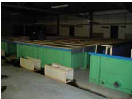
写真13. アニフスキーふ化場養魚水槽.