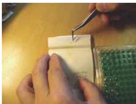
写真4. 片方の耳石を採取.