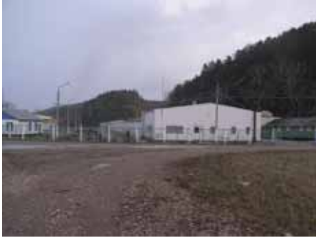
写真5. 国営レスノイふ化場.