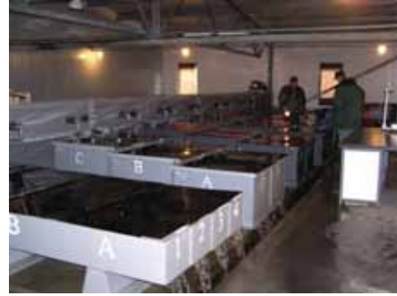
写真6. レスノイふ化場ふ化室.