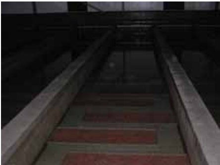
写真7. レスノイふ化場養魚池.