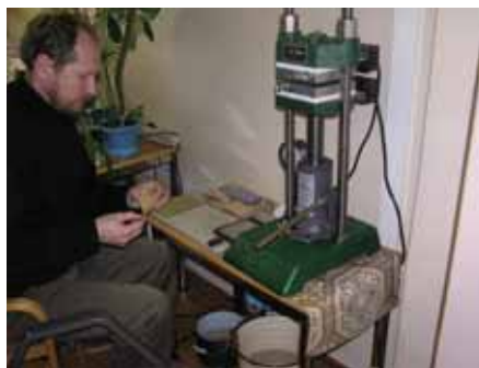
写真2. 鱗レプリカ作成.