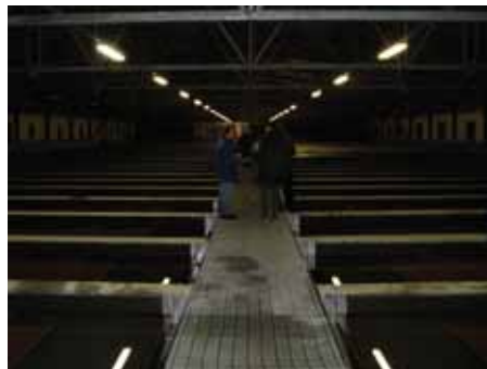
写真14. アニフスキーふ化場養魚池.