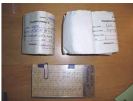
写真3. 耳石（上段）、鱗（下段）サンプル.