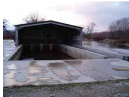
写真10. アチェプハ川蓄養池.