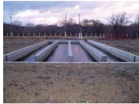
写真8. レスノイふ化場飼育池.