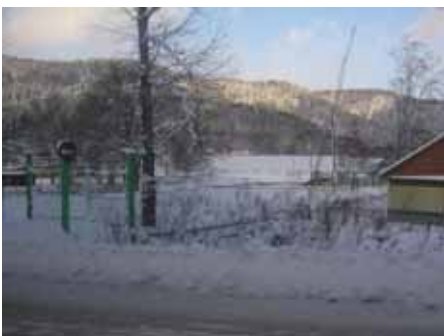
写真11. 国営アニフスキーふ化場.