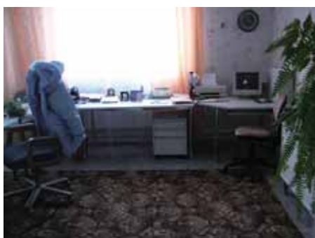
写真15. アニフスキーふ化場事務室.