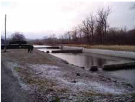
写真9. アチェプハ川捕獲場.