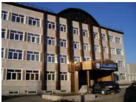
写真1. サフニーロ庁舎.