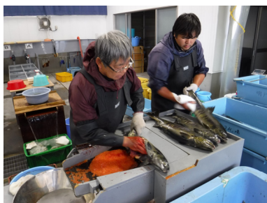
②採卵（洗卵するため、卵は受卵盆の5分目程度の収容とする）