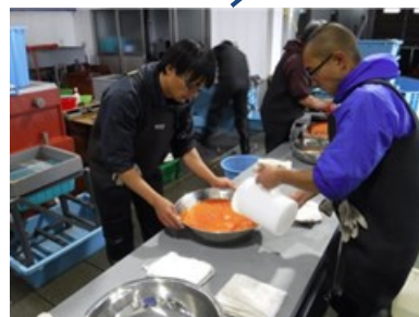
③等張液洗卵（3L程度の等張液を受卵盆に灌ぎ洗卵後、シャワー洗卵を実施）