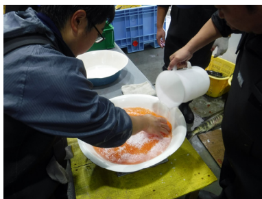
⑤洗浄（3L程度の等張液を受卵盆に灌ぎ洗卵、2回）