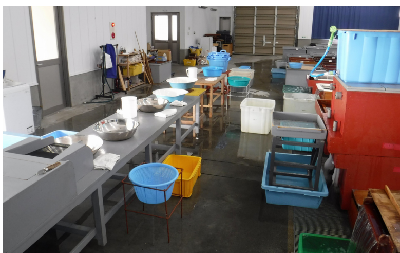
洗卵工程全体図（採卵から吸水前消毒までの動線を直線状に配置）