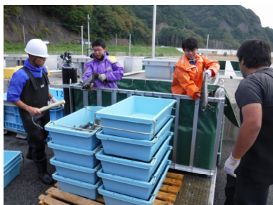
①鑑別（雌親魚は4～5尾ずつバットに収容）