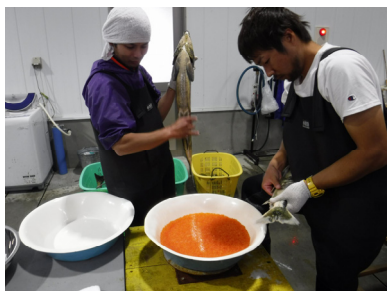
④受精（媒精し、等張液により受精させる）