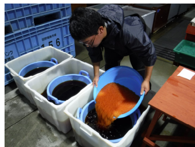
⑥吸水前消毒（等張液ポビドンヨード液に15分間浸漬）

その後は、通常の採卵工程と同様、⑦洗浄（真水）、⑧吸水（真水で1時間）後にふ化槽に⑨収容する。